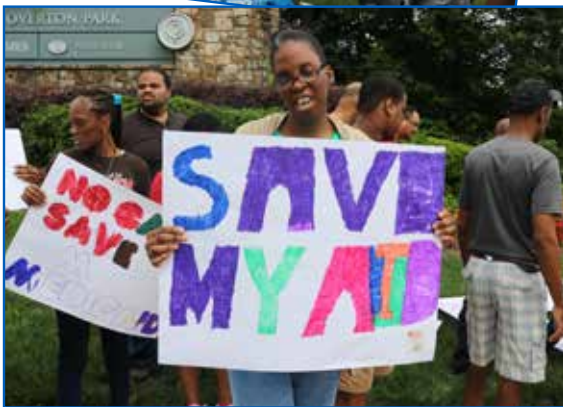
Los defensores de derechos representando a GCDD protestan ante la oficina de Georgia del Senador de los EEUU, Johnny Isakson en junio apoyando la campaña No Cuts! No Caps! para salvar al Medicaid.