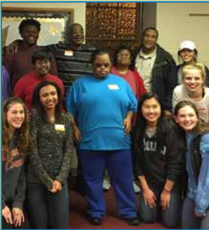
Gifted Harmony es un grupo de coro inclusivo compuesto por doce cantantes de varias edades y razas, todos con discapacidades - desde el Síndrome de Down hasta el Autismo -

Los esfuerzos fundamentales a nivel comunitario están ayudando a forjar comunidades más fuertes tanto en Macon como en Lawrenceville, al resaltar los talentos y las destrezas de personas con discapacidades. Estos resultados satisfactorios están promoviendo la sensibilización, cambiando actitudes y fomentando la inclusión entre ciudadanos comunes – todo esto es posible gracias a las acciones de aquellas personas que decidieron asumir la responsabilidad de hacer cambios en sus propias comunidades.