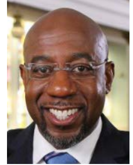
Rev. Raphael Warnock

Raphael Warnock y Jon Ossoff , y los dos candidatos demócratas han aceptado oficialmente los resultados y reclamado la victoria. Ambos hombres fueron respaldados por